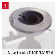
N. articolo G1000A152A