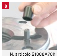
N. articolo G1000A70K