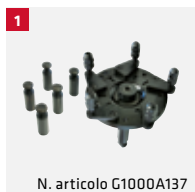
N. articolo G1000A137