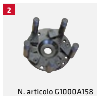
N. articolo G1000A158