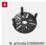
N. articolo G1000A161