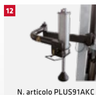
N. articolo PLUS91AKC

1 Flangia universale per ruote cieche /rovescie. Per G1000A138.