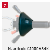
N. articolo G1000A84K