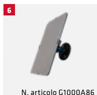
N. articolo G1000A86