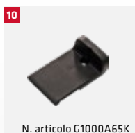
N. articolo G1000A65K