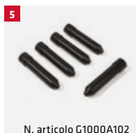
N. articolo G1000A102