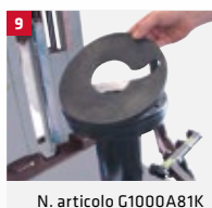
N. articolo G1000A81K