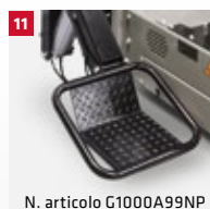
N. articolo G1000A99NP