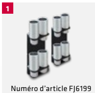
Numéro d'article FJ6199