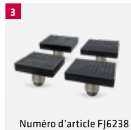
Numéro d'article FJ6238