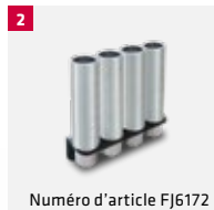
Numéro d'article FJ6172