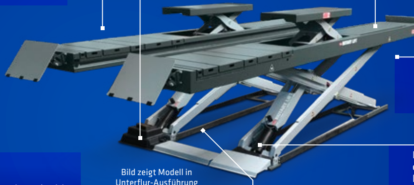
Bild zeigt Modell in Unterflur-Ausführung

Das Bedienpult besitzt ein werkseitig vormontiertes, mit der Hebebühne verbundenes Hydraulikaggregat und trägt damit maßgeblich zu einem geringen Installationsaufwand bei. Die Platzierung ist links oder rechts möglich.