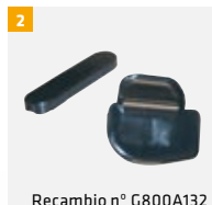
Recambio n° G800A132