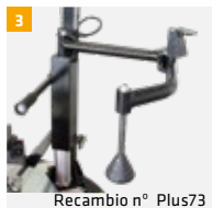
Recambio n° Plus73