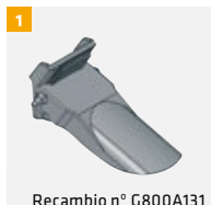
Recambio n° G800A131