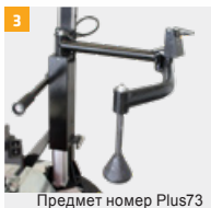
Предмет номер Plus73