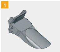
Предмет номер G800A131