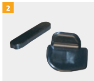
Предмет номер G800A132