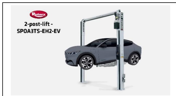
2-стоечный подъемник - SPOA3TS-EH2-EV