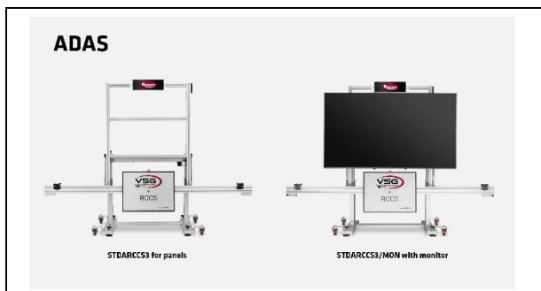
Устройство выравнивания колес - ADAS